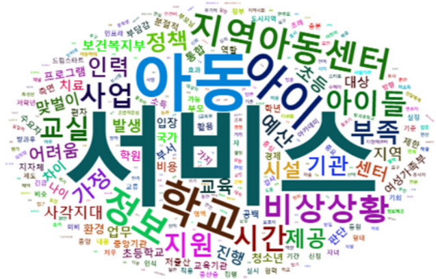
<그림1> 아이돌봄제도 문제점과 한계 워드클라우드

가장 많은 출현빈도를 보인 단어는 ‘서비스’로 50회(10.9%)로 나타났다. 이는 아이돌봄과 관련한 제도를 조사대상자들이 아이돌봄제도를 서비스의 영역으로 인식하고 있기 때문인 것으로 볼 수 있다. 다음은 아동 34회(7.4%), 아이 29회(6.3%)의 출현빈도가 높았다. 이는 본 서비스의 대상자가 아동 혹은 아이이기 때문인데, 정부부처에 서비스 수혜대상을 아이로 보느냐 아동으로 보느냐에 따른 차이가 있기 때문인 것으로 분석된다.