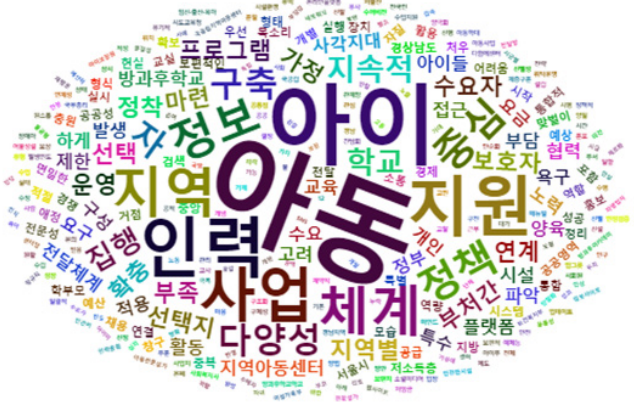
<그림2> 아이돌봄제도 개선 방안 워드클라우드

가장 많은 출현빈도를 보인 단어는 '아동' 19회(8.1%), '아이' 18회(7.6%)로 나타났다. 앞서 문제점에서 살펴본 바와 동일한 사유로 보인다. 다음으로는 '인력' 11회(4.7%), '지원' 11회(4.7%), '지역' 9회(3.8%), '체계' 9회(3.8%), '정보' 8회(3.4%), '선택' 8회(3.4%)의 순으로 높은 빈도를 보였다.