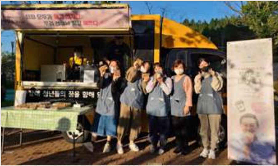
경상남도사회서비스원, 제1회 돌봄종사자의 날 주간 힐링온유 프로그램 실시.