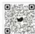
국민신문고 120 앱으로 접수하기