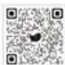
국민신문고 120 전화