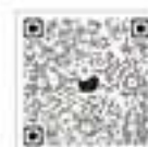
국민신문고 120 접수하기